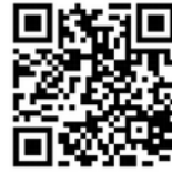
Download คู่มือการใช้งานระดับส่วนกลาง